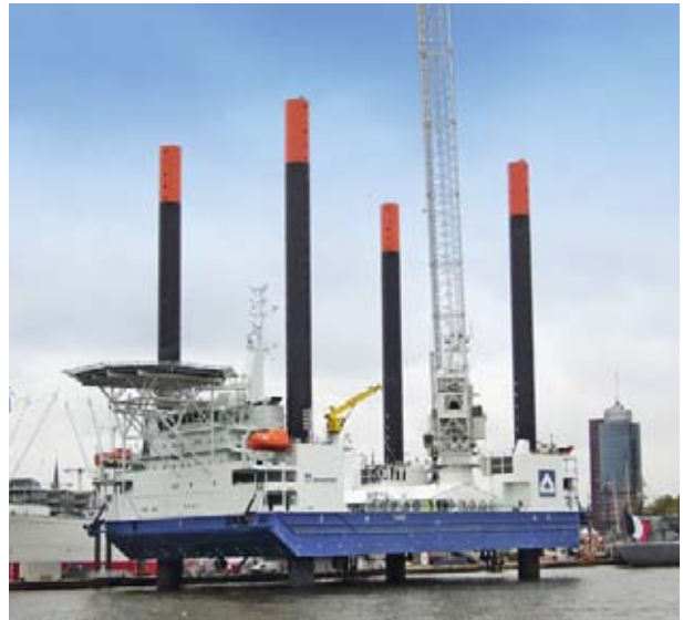
R+S Stolze GmbH zeichnet für die komplette Elektrotechnik sowie für die Navigations- und Kommunikationssysteme verantwortlich.

Der Bedarf für derartige Riesen ist jedenfalls vorhanden. Derzeit sind zahlreiche Anlagen auf See im Bau oder in Planung. Unternehmen, die die dafür nötige Technik anbieten, sind voll ausgelastet. Ihren ersten Auftrag hat die nach dem nordischen Donnergott benannte Hubinsel bereits erledigt. Als man sie im April mit Schleppern über den Öresund nach Bremerhaven überführte, hatte „Thor“ Material für den Bau der Kaiserschleuse in Bremerhaven im Gepäck.