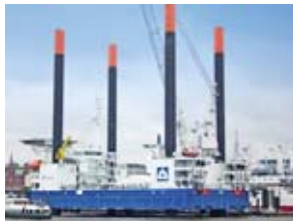
„Thor“ wurde insbesondere für die Errichtung von Offshore-Windenergieanlagen konstruiert.

R+S Stolze GmbH zeichnet als Systemlieferant für die komplette Elektrotechnik, Navigations- und Kommunikationssysteme der Jack-up-Barge verantwortlich. Anders als herkömmliche Montageschiffe