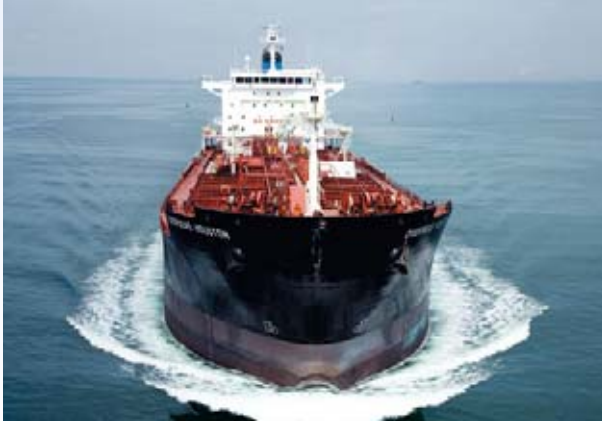
Overseas Houston – ein Schiff aus der Baureihe Tanker 45.000 DWT auf Probefahrt

Ein hanseatisches Unternehmen hat den Sprung über den Großen Teich geschafft: Als Tochterunternehmen der R+S Stolze GmbH zeichnet Stolze Inc. Philadelphia in den USA insbesondere für die Elektrotechnik im Schiffbau verantwortlich.