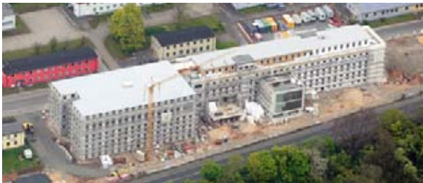
Ab September dieses Jahres geht das Medicum Fulda mit gebündelter Fachkapazität an den Start.

Auch die Reha-Klinik Dr. Wüsthofen* mit Sitz in Bad Salzschlirf ist mit einem Programm zur integrativen ambulanten und wohnortnahen muskuloskeletalen Rehabilitation auf 500 Quadratmetern mit im Boot. Ebenso haben sich das Sanitätshaus Keil