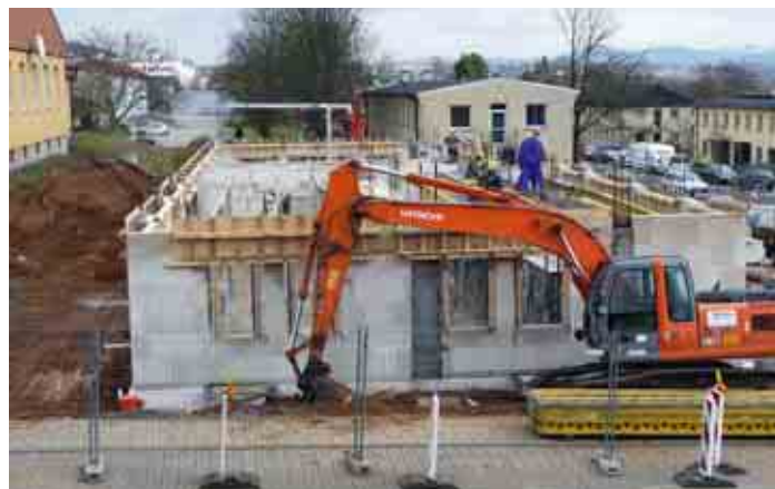
Flemingstraße 18 im März 2009