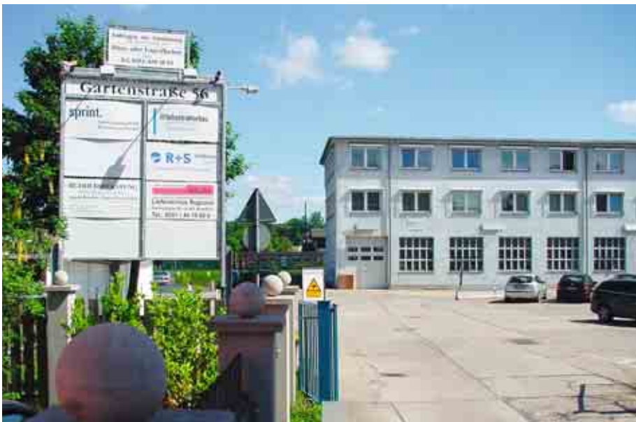
Im Frühjahr 2009 ist die R+S solutions GmbH Dresden nach Radebeul umgezogen.

Neuer Kontakt: R+S solutions GmbH Dresden Gartenstraße 56 01445 Radebeul Tel. 0351/ 2067060