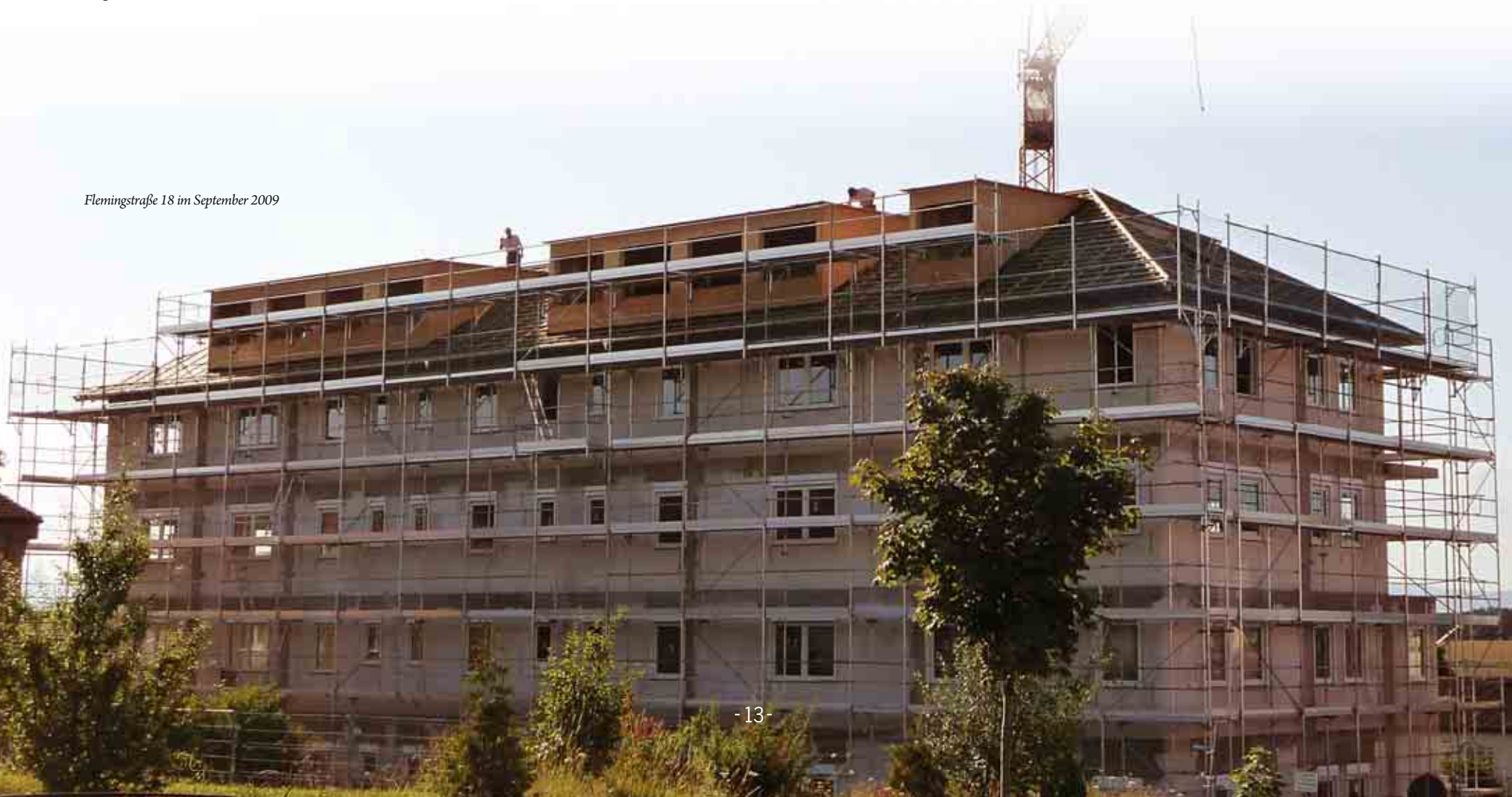
Flemingstraße 18 im September 2009