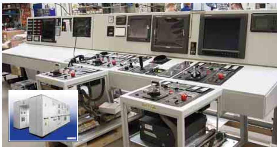
Von R+S Stolze GmbH erstellte Hauptschalttafel (kleine Abbildung) und das noch im Bau befindliche Brückenpult (große Abbildung) für die Jack-Up Plattform Thor.

Lübeck/Fulda. Wo vor etwa einem Jahr mit großer Hoffnung und verhaltenen Erwartungen der offizielle Startschuss der R+S Stolze GmbH in Lübeck gegeben wurde, sind Unternehmensleitung und Mitarbeiter zwölf Monate später optimistisch und sehen der Zukunft positiv entgegen.