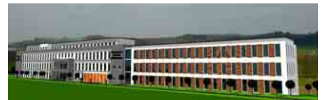
Das künftige Gesundheitszentrum Münsterfeld