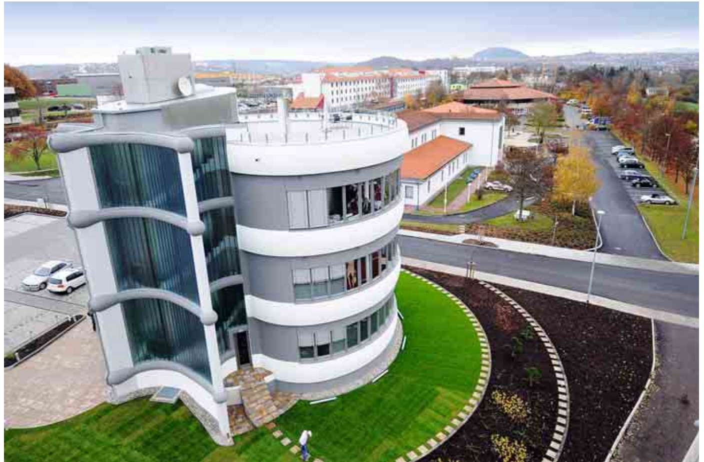
Businessclub in der Münsterfeldallee

Dazu zählen unter anderem der Bau eines Miet- und Geschäftshauses in der Flemingstraße 18 sowie der Bau des Fulda Businessclubs in der Münsterfeldallee. Auch durch die R+S building solutions GmbH wird nochmals deutlich die Unternehmensphilosophie „Alles aus einer Hand“ unterstrichen und das Leistungsspektrum der Gruppe abgerundet.